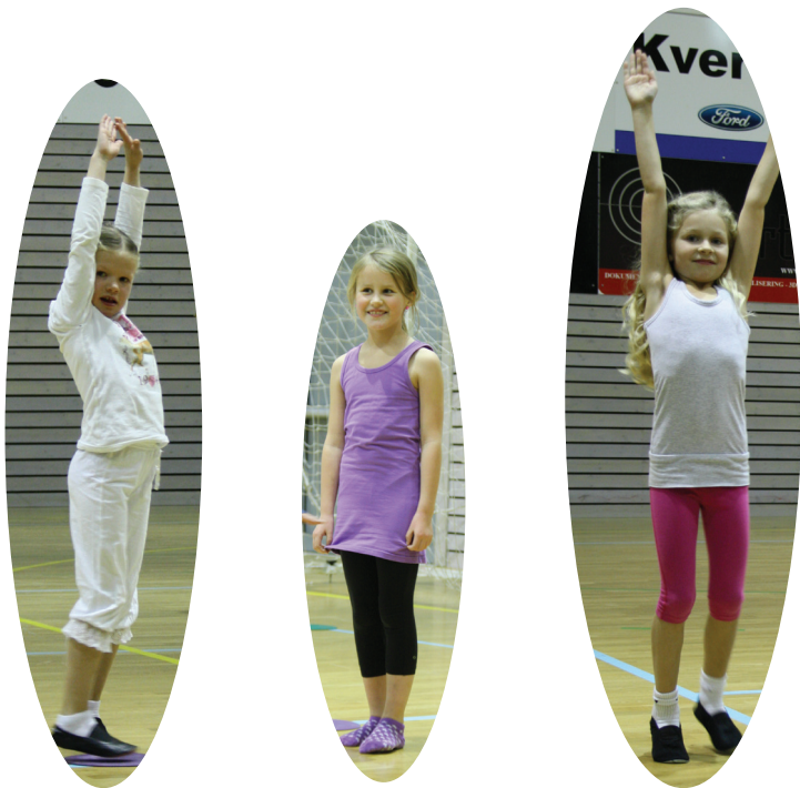
De store turner og danser!

På en helt vanlig onsdag er det fullt liv i hallen. Her er noen glimt fra barnegruppa mellom 1 og 3 år, 5-åringene og 1-4. klasse. Trenerne sier det er kjekt å gjøre noe sammen med ungene.