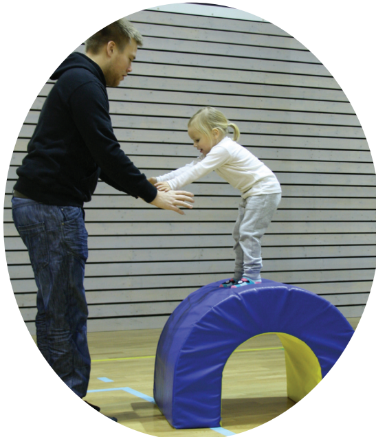
Trygt å hoppe til pappa!