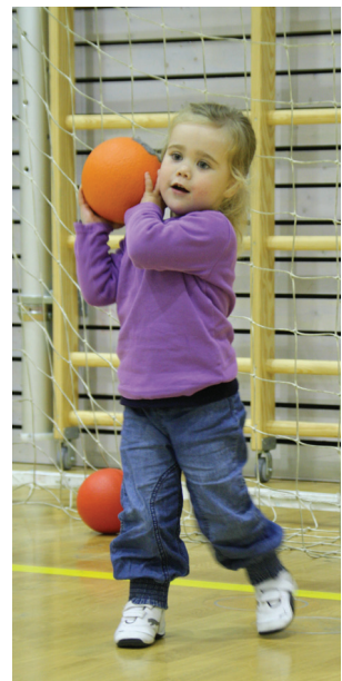
God i mål!