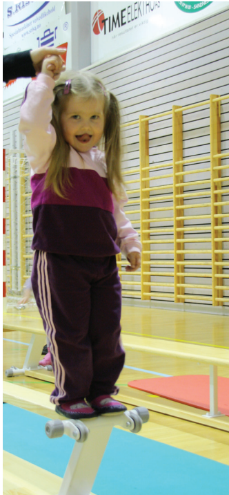
Ved balansetrening er det godt å ha ei hånd å holde i!