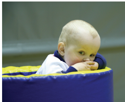
Noen syntes det var godt med en liten hvil!