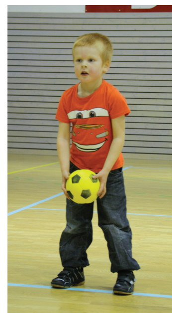
Det er viktig å lære å håndtere ballen! Håndballstjerner i sikte, kanskje?